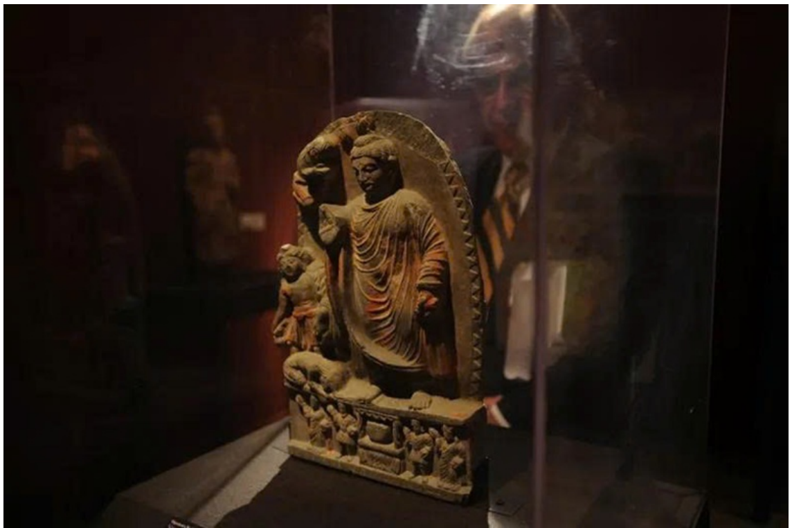
Cấu trúc kiến trúc được khai quật tại khu tầng xá (nơi ở của tầng sĩ) ở Mes Aynak.

Lịch sử Phật giáo tại Afghanistan từ sau thế kỷ XI đến nay không còn là biên niên sử của một tôn giáo sống, khi những cộng đồng Phật tử bản địa đã hoàn toàn tan biến vào cát bụi thời gian. Trang sử ấy đã chuyển mình thành một khúc ca bi tráng về sự suy tàn tuyệt đối dưới những cuộc viễn chinh đẫm máu, trải qua nửa thiên niên kỷ bị lãng quên trong hoang vu, để rồi khép lại bằng một cuộc chiến bảo tồn di sản đầy kịch tính và nghẹt thở giữa thế kỷ XXI.