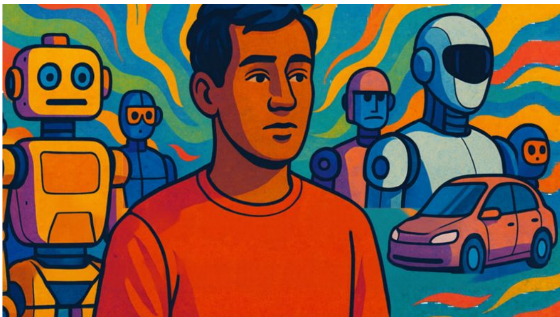
Hình mang tính minh họa.

Khi AI ngày càng tinh vi trong việc phân tích hành vi và sở thích người dùng, mức độ cá nhân hóa này sẽ còn mạnh mẽ hơn nữa. Nếu mạng xã hội từng là chất xúc tác cho chủ nghĩa cá nhân, thì AI có nguy cơ làm cho xu hướng ấy trở nên gây nghiện hơn gấp bội.