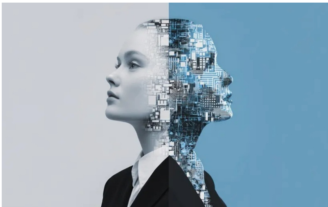
Hình mang tính minh họa.

AI có thể xử lý dữ liệu, mô phỏng đối thoại hay tạo ra nội dung rất thuyết phục, nhưng không thực sự sống, cảm nhận hay trải nghiệm như con người.