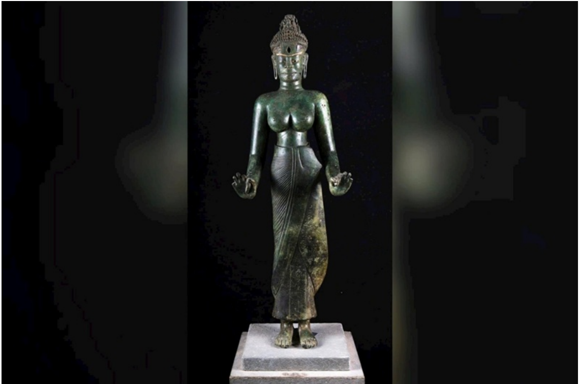
Bảo vật quốc gia tượng Bồ tát Tara có tuổi đời 1.200 năm tuổi được tìm thấy tại Phật viện Đồng Dương.

Cách tiếp cận này cho phép chuyển dịch trọng tâm từ “bảo tồn phế tích” sang “tái tạo ý nghĩa”, đặc biệt phù hợp với các di sản tôn giáo đã bị suy giảm về hình thái vật chất như Phật viện Đồng Dương.