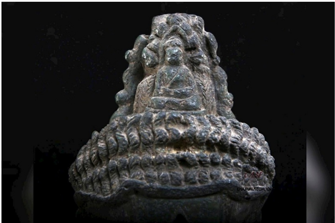
Hình tượng Đức Phật ngồi dưới tán rắn bảy đầu Mucalinda, tay trái cầm thanh kiếm gãy.