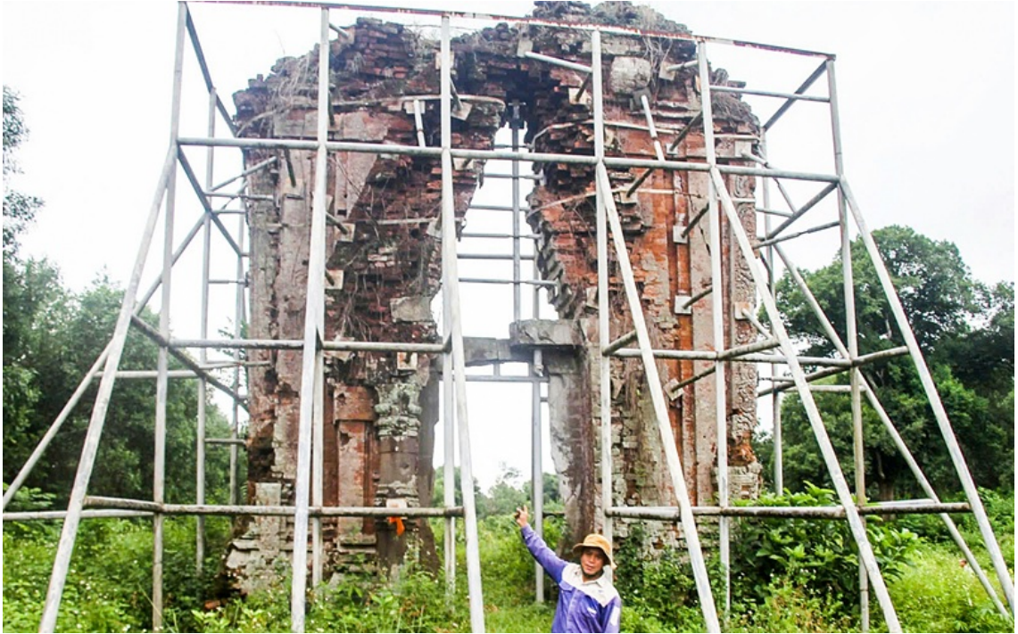
Chạm lòng Phật viện Đồng Dương: Chỉ còn tháp Sáng chực chờ ngã đổ.

Kết quả nghiên cứu cho thấy, cách tiếp cận bảo tồn di sản truyền thống vốn chủ yếu tập trung vào các yếu tố vật thể như kiến trúc và hiện vật bộc lộ nhiều hạn chế khi áp dụng đối với Phật viện Đồng Dương. Trong nhiều thập niên, các nghiên cứu và hoạt động bảo tồn chủ yếu hướng tới việc phục dựng mặt bằng kiến trúc, bảo quản hiện vật điêu khắc và xác định niên đại di tích (Ngô Văn Doanh, 2015; Huber, 1911). Tuy nhiên, đối với Đồng Dương, phần lớn cấu trúc vật thể đã bị phá hủy nghiêm trọng bởi chiến tranh và thời gian, khiến việc phục dựng nguyên trạng gần như không khả thi.