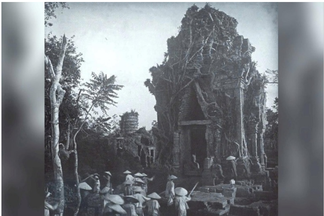
Phật viện Đồng Dương được khai quật năm 1902.

Nghiên cứu về Phật giáo Chăm Pa nói chung và Phật viện Đồng Dương nói riêng đã hình thành một nền tảng học thuật tương đối phong phú, trải dài từ các khảo cứu kinh điển đầu thế kỷ XX đến các tiếp cận liên ngành đương đại. Có thể phân loại các kết quả nghiên cứu thành ba hướng chính: (i) nghiên cứu lịch sử - khảo cổ; (ii) nghiên cứu nghệ thuật và biểu tượng; (iii) nghiên cứu tôn giáo - tư tưởng.