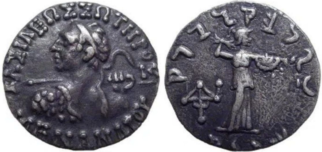
Đồng xu drachm Menander I Soter song ngữ.

Ẩn sau những danh xưng cổ kính của các bậc hoàng pháp là những mật mã lịch sử chờ được giải mã. Dù cuốn Mahavamsa chưa từng tuyên bố Tôn giả Majjhantika là người phương Tây, các nhà nghiên cứu vẫn tìm thấy một sợi dây liên kết ngôn ngữ thú vị: danh xưng của Ngài dường như được ghép từ chữ "Maha" (Vĩ đại) và "Antika" - cách gọi gợi nhắc đến cái tên Antiochos lừng lẫy của người Hy Lạp. Sự hoài nghi mang tính khoa học này tiếp tục hướng về Tôn giả Maharakkhita, người đã dấn thân vào thủ phủ của cư dân Yona để truyền bá đạo vàng. Giữa một vùng đất thắm đẫm văn minh Địa Trung Hải, một sứ mệnh vĩ đại như thế dường như chỉ có thể được giao phó cho một người bản địa thấu hiểu sâu sắc văn hóa nơi đây. Dẫu giả thuyết về việc Ngài Maharakkhita là một người Hy Lạp vẫn còn bỏ ngỏ, nó đã dệt nên một bức tranh huyền ảo và đầy lôi cuốn về thời kỳ bình minh của Phật giáo thế giới.