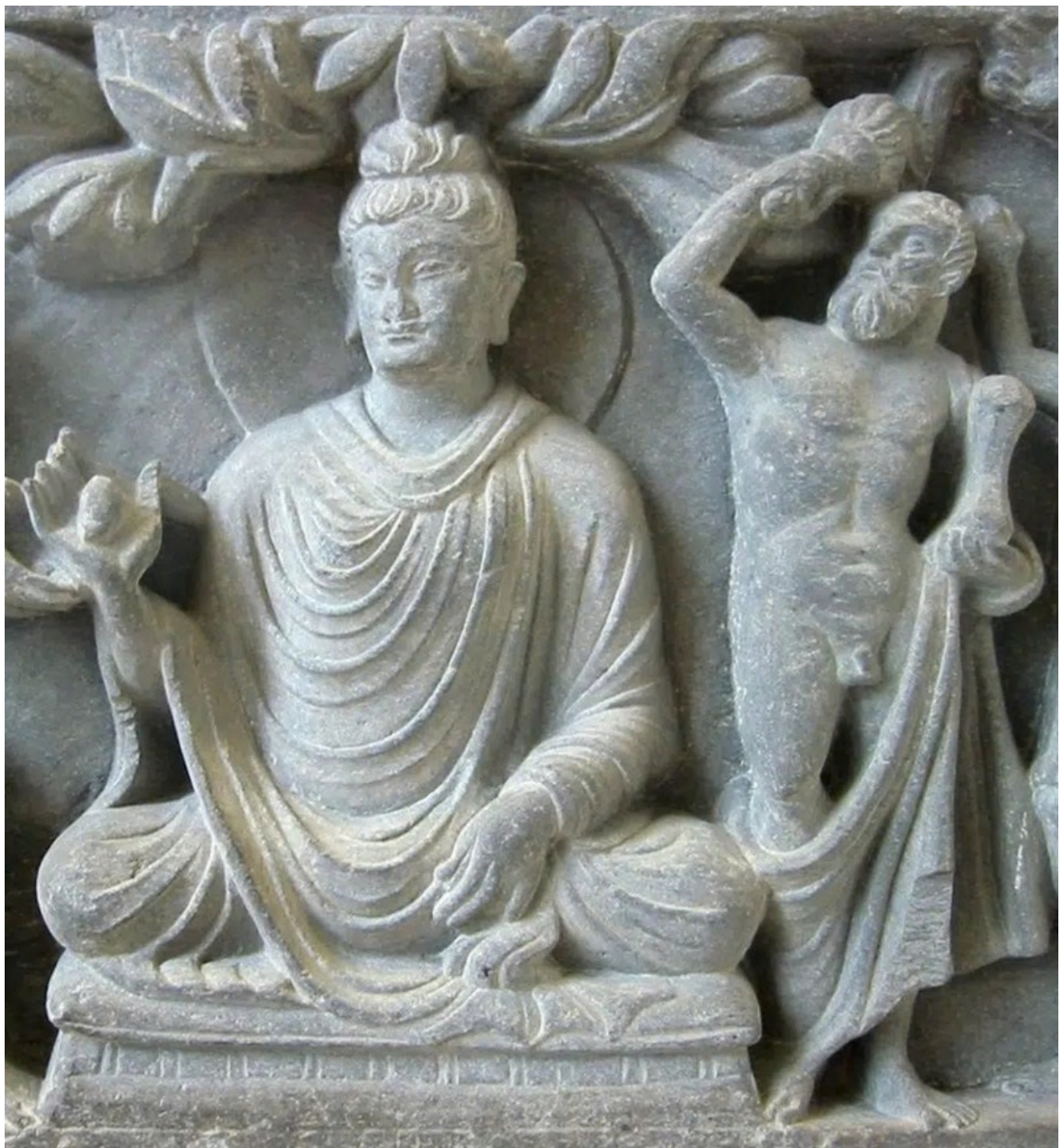
Đức Phật và Hộ pháp Vajrapani (Kim Cương Thủ) được khắc họa dựa trên hình mẫu của á thần Hercules trong thần thoại Hy Lạp.

Trải qua nhiều thế kỷ, trường phái nghệ thuật Gandhāra (Hy Lạp - Phật giáo) vẫn đứng vững như một biểu tượng thị giác độc nhất vô nhị, tỏa sáng từ thế kỷ I trước Tây lịch đến thế kỷ VII sau Tây lịch dọc theo dải đất Pakistan và Afghanistan hiện đại.