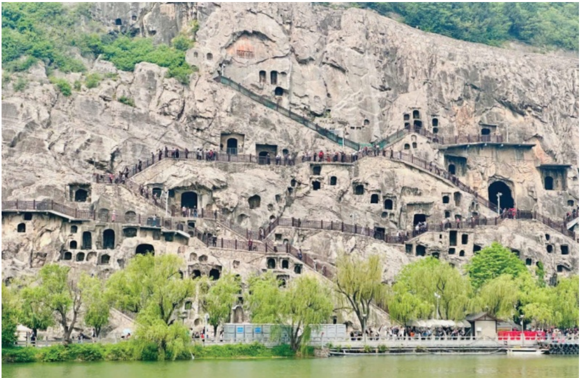
Khu hang đá Long Môn, Trung Quốc.

Một lần có người đến thỉnh giáo Đại sư: “Thưa Đại sư, con đọc rất nhiều kinh sách nhưng vẫn thấy tâm mình không an.” Ngài hỏi lại: “Con đọc kinh để làm gì?” Người ấy đáp: “Để hiểu Phật pháp.” Ngài nói: “Đọc kinh không phải chỉ để biết nhiều. Đọc một câu mà làm được một câu, còn hơn đọc ngàn quyển mà không thực hành.”[23].