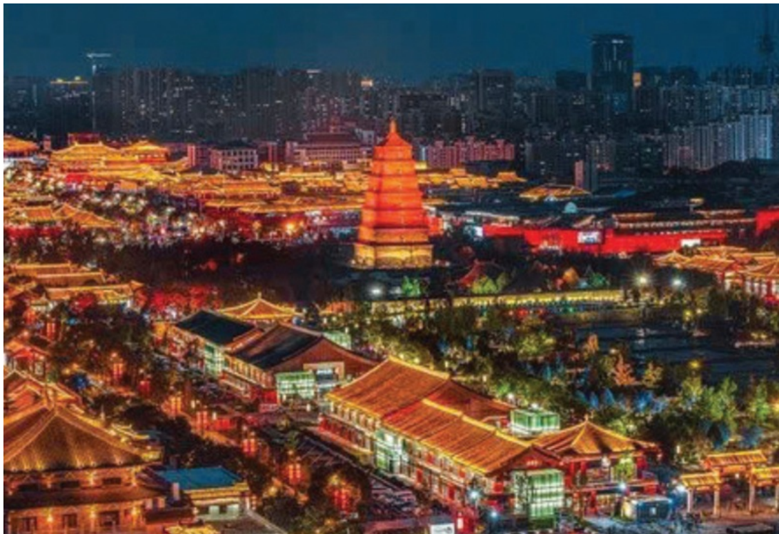
Tây An, Trung Quốc.

Trong tiến trình tu học Phật giáo, kinh điển (pháp bảo) giữ vai trò nền tảng trong việc hình thành chính kiến, là kim chỉ nam cho con đường tu tập.