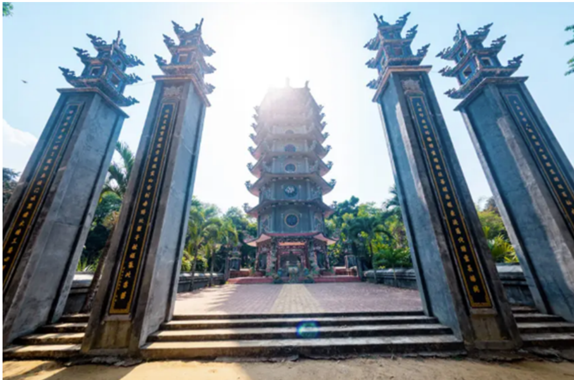
Tòa bửu tháp uy nghi trong khuôn viên chùa Thiên Ân.

Về kiến trúc, chùa Thiên Ân gây ấn tượng bởi những họa tiết cầu kỳ hình lưỡng long chầu nguyệt cùng cuốn thư và hệ thống câu đối được trang trí ngay cổng ra vào. Phía trên cánh cổng - gác tam quan được đặt bức tượng thần Hộ pháp bảo vệ chùa. Bước tiếp vào trong là hai dãy tượng La Hán ở hai bên những bức tượng Phật.