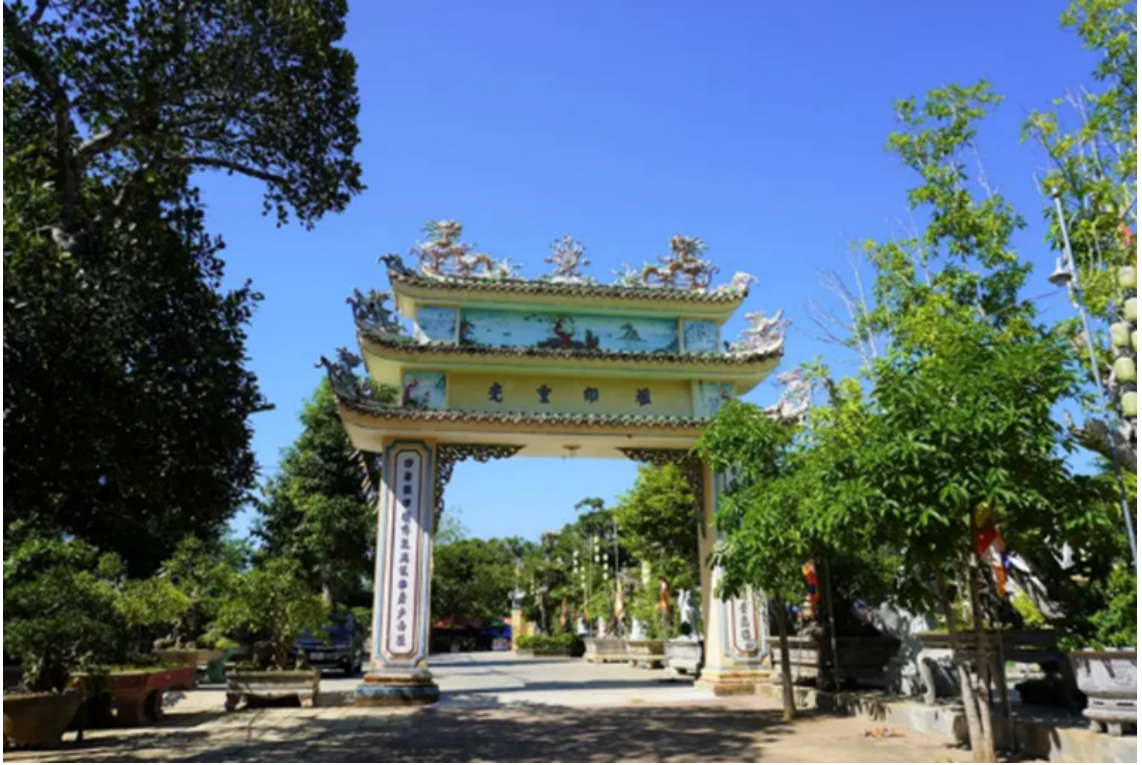
Cổng chùa Thiên Ân (Quảng Ngãi). Sư tầm

Theo các truyền thuyết dân gian tại địa phương, cách đây khoảng 4 thế kỷ, vùng núi Thiên Ân được ví như chốn u linh, rừng cây rậm rạp, chỉ có muông thú ở. Chính vì vậy, rất ít người lên núi Thiên Ân, chỉ có người đốn củi thỉnh thoảng lên đây nhưng tuyệt đối không dám ở qua đêm trên khu rừng hoang vu này.