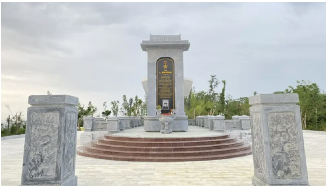
Mộ Cụ Huỳnh Thúc Kháng tọa lạc tại phía đông chùa Thiên Ấn (Quảng Ngãi).

Ngoài ra, phía Tây Nam khuôn viên chùa là nơi tọa lạc mộ cụ Huỳnh Thúc Kháng (1876 - 1947) - một nhà chí sĩ yêu nước nổi tiếng của Việt Nam. Ngôi mộ được thiết kế đơn giản, trang trọng, gắn bó hài hòa với tổng thể cảnh quan chùa Thiên Ấn.