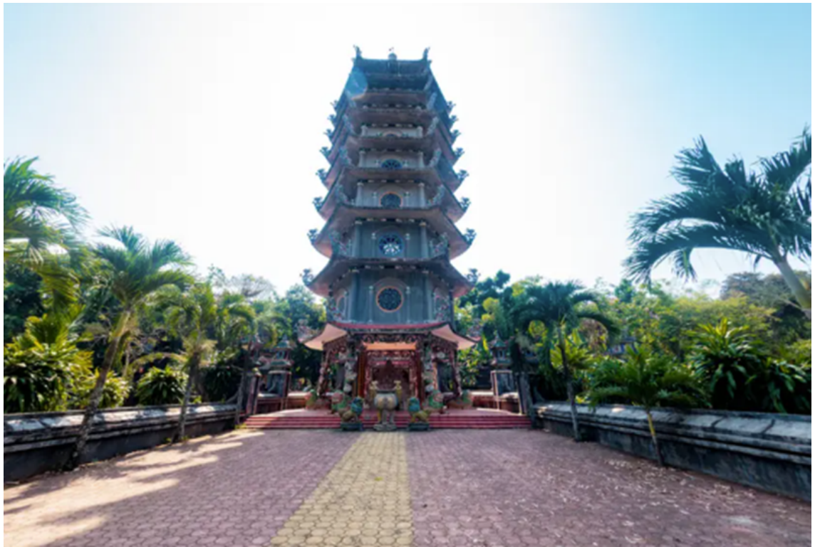
Tòa bửu tháp uy nghi trong khuôn viên chùa Thiên Ấn (Quảng Ngãi).

Chùa Thiên Ấn nằm uy nghi trên đỉnh núi Thiên Ấn, thuộc xã Tịnh Ấn, huyện Sơn Tịnh (cũ), tỉnh Quảng Ngãi. Đây là vị trí " tọa sơn hướng thủy ," một đặc điểm thường thấy trong kiến trúc chùa Việt Nam, mang ý nghĩa phong thủy tốt lành. Chùa không chỉ là một địa điểm linh thiêng của Phật giáo mà còn gây ấn tượng bởi vẻ đẹp thanh tịnh và cổ kính. Với bề dày lịch sử hơn 300 năm, nơi đây thu hút du khách bởi không gian yên bình, hài hòa giữa thiên nhiên và kiến trúc độc đáo. Đây cũng là một ngôi chùa xưa nhất và lớn nhất của Giáo hội Phật giáo Quảng Ngãi.