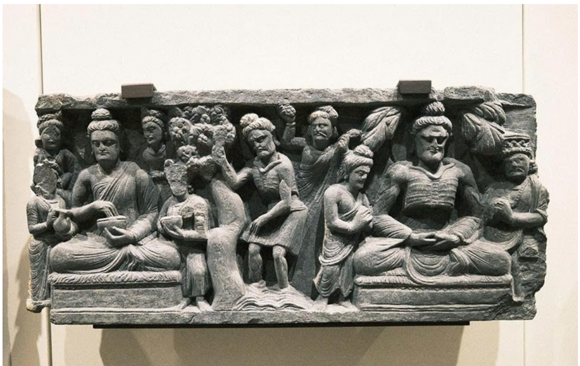
Cuộc đại khổ hạnh và việc tìm ra Con đường Trung đạo. Pakistan, Gandhara, thế kỷ II - III, đá phiến.

Nguyên lý Trung đạo gắn liền với một bước ngoặt quan trọng trong hành trình tìm đạo của Đức Phật Thích Ca Mâu Ni (Siddhartha Gautama), một nhân vật có thật trong lịch sử, nhà tư tưởng và là người sáng lập đạo Phật. Vốn sinh ra trong nhung lụa chốn hoàng cung, nhưng sau khi chứng kiến cảnh già nua, bệnh tật và cái chết, Ngài đã từ bỏ vinh hoa để dấn thân vào con đường ép xác khổ hạnh cùng cực nhằm tìm lối thoát khỏi những nỗi khổ niềm đau.