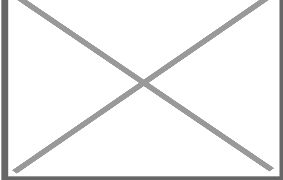
Gác chuông chùa

Quỳnh Lâm (Quảng Ninh)[/caption]