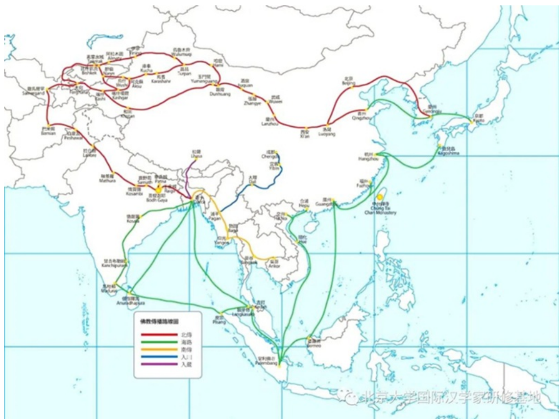
Bản đồ giao thông vận tải ở các vùng phía Tây và Biển Đông