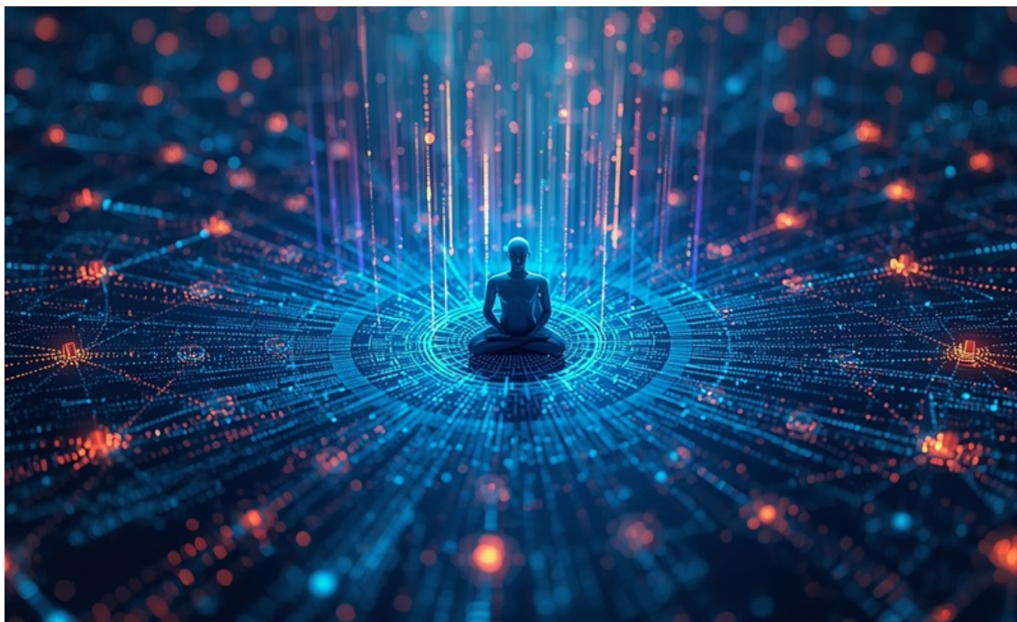
Hình minh họa tạo bởi AI

Trong giáo lý Phật giáo, nghiệp (karma) không phải là định mệnh, mà là tập hợp các điều kiện tích lũy từ hành động, lời nói và ý nghĩ, từ đó chi phối kết quả trong tương lai.