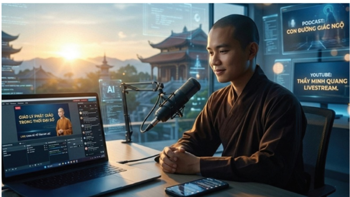
Hình ảnh được tạo bởi AI

Sự hiện diện của công nghệ số trong đời sống hôm nay đã làm thay đổi rất nhiều cách con người tìm kiếm tri thức và nuôi dưỡng đời sống tinh thần. Với Phật giáo, sự thay đổi ấy có thể nhìn thấy khá rõ. Công nghệ đã làm cho việc học Phật trở nên dễ hơn mỗi ngày, không cần tới giảng đường, tìm sách kinh, đợi khoá học mà có thể nghe một bài pháp thoại trên YouTube, theo dõi một buổi livestream, đọc một bài viết trên website Phật giáo, nghe podcast khi đang làm việc khác, hoặc tham gia một cộng đồng học Phật trực tuyến,... (8)