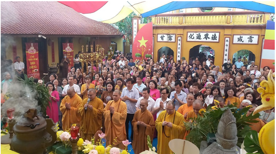
Chư tôn đức cùng các vị Đại biểu làm lễ dâng hương bạch Phật bái Tổ tại chính điện chùa Duệ Tú.