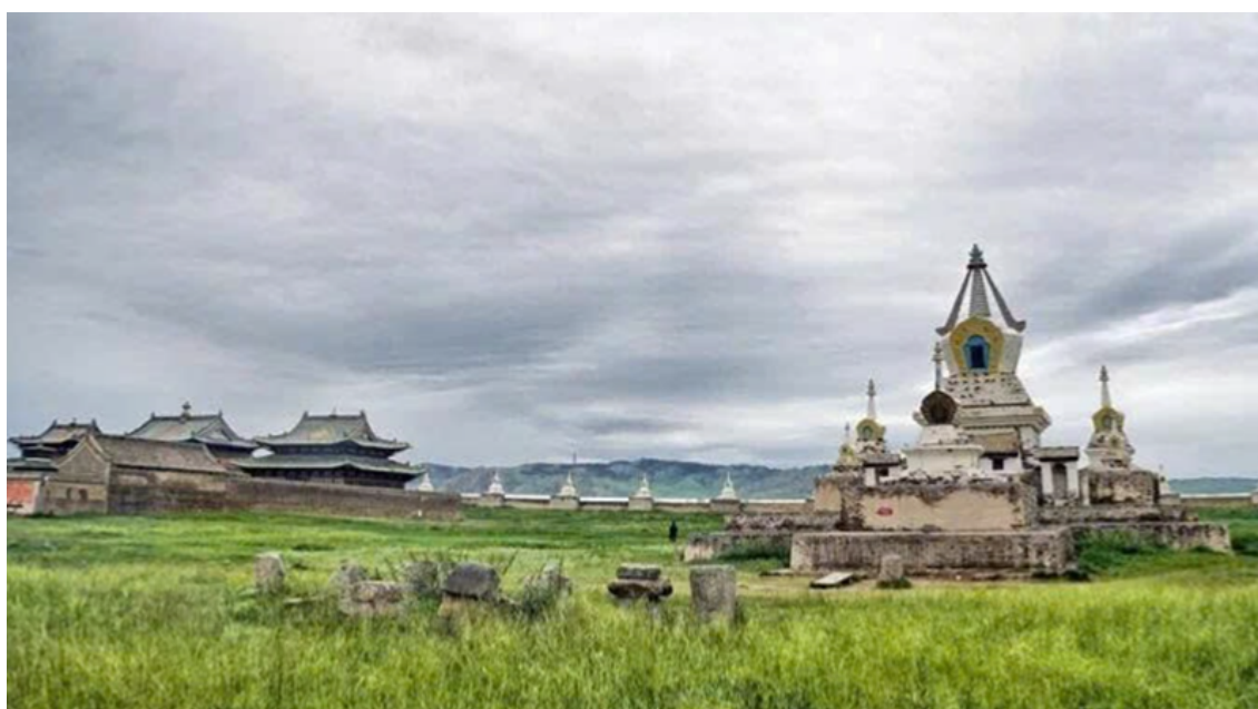
Tu viện Gandantegchinlen.