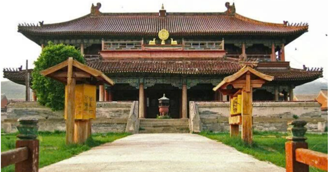
Tu viện Amarbayasgalant.

hành. Dẫu vậy, tầm ảnh hưởng sâu rộng của Shaman giáo bản địa tại tầng lớp bình dân thời bấy giờ vẫn là một thách thức lớn đối với vương triều.