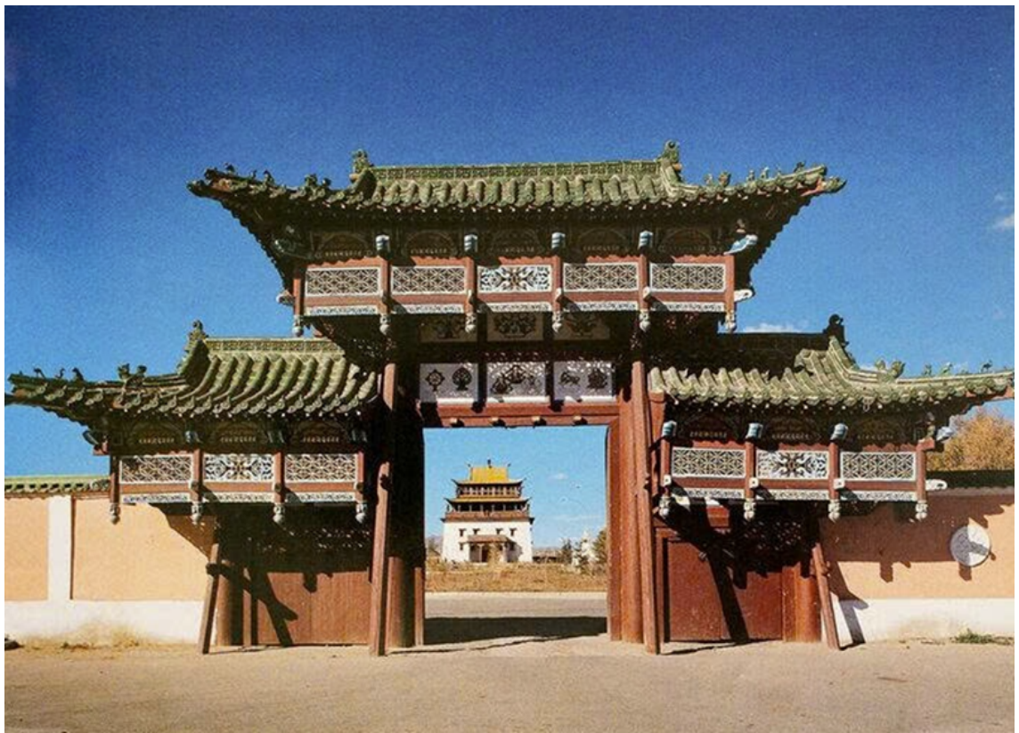
Tu viện Gandan trước năm 1990.

Để đáp lại tiếng vọng tâm linh ấy, Hoàng đế Ashoka đã ban sắc lệnh, cử những phái đoàn Sứ giả Như Lai mang ngọn đuốc chính pháp soi đường vào cõi hoang vu. Từ thế kỷ thứ III trước Tây lịch, ánh sáng từ bi bắt đầu len lỏi qua các triền núi, sưởi ấm thảo nguyên lạnh giá. Hành trình dẫn thân đầy gian khổ ấy đã gieo những hạt giống đức tin đầu tiên lên nền đất cằn cỗi. Đó rất có thể là buổi bình minh của Phật giáo Nam truyền (Theravada Buddhism), một dòng chảy thanh tịnh đã chọn bám rễ vào tâm thức kiên cường của người dân du mục.