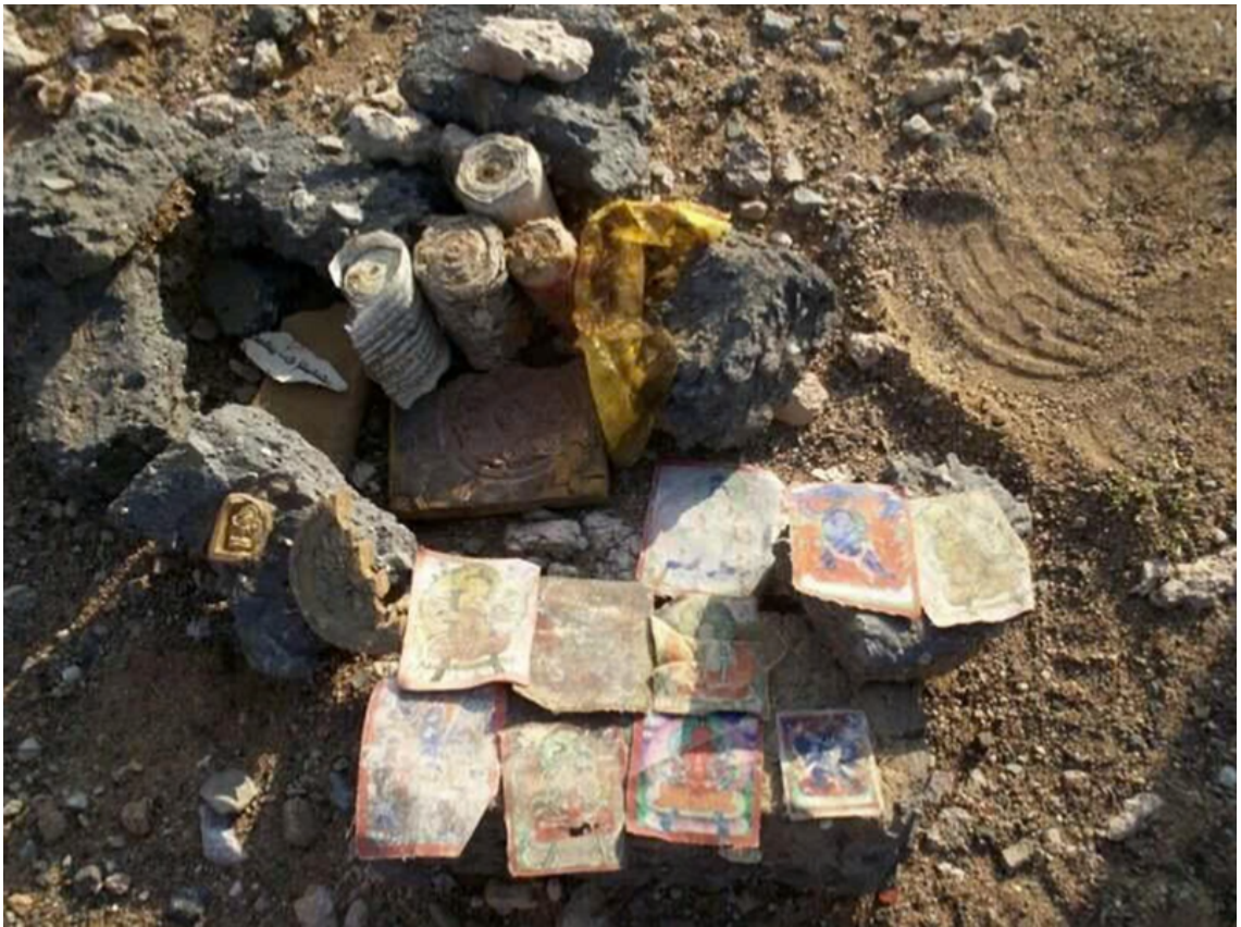
Các vật phẩm linh thiêng bị bỏ lại tại một khu di tích tu viện đổ nát.

Trước khi khép lại vào đầu năm 1939, cuộc đại thanh trừng đã bằm vụn đời sống Mông Cổ, chôn vùi hàng thế kỷ di sản văn hóa dưới lớp tro tàn bụi bặm. Nỗi đau thương bao trùm lên đức tin của người dân du mục khi 18.000 vị Lạt Ma bị kết án tử hình, hàng ngàn người khác bị ép buộc phải cầm súng ra chiến trường. Lần lượt hơn 700 ngôi chùa lớn nhỏ bị đập phá, đặt dấu chấm hết cho thời kỳ hưng thịnh của Phật giáo thảo nguyên.