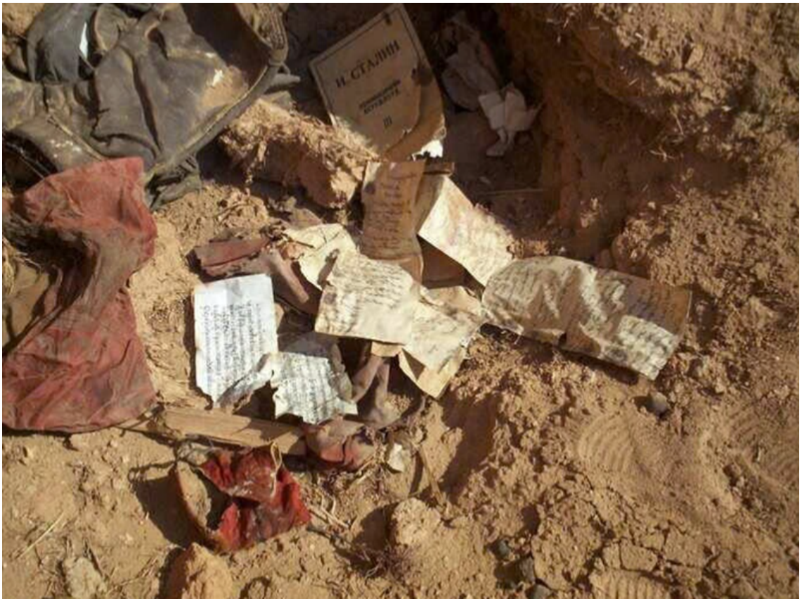
Các vật phẩm linh thiêng bị bỏ lại tại một khu di tích tu viện đổ nát. Tài liệu thuộc dự án "Tài liệu về các tu viện Mông Cổ". https://www.mongoliantemples.org/en/

Bước sang năm 1934, Điện Kremlin can thiệp sâu nhưng đã vấp phải bức tường sừng sững mang tên Peljidiin Genden. Trên cương vị Thủ tướng, ông kiên quyết trì hoãn hiệp ước song phương - thứ tối hậu thư cho phép quân đội Liên Xô đồn trú. Bản lĩnh của Genden đỉnh điểm là khi ông công khai khước từ áp lực từ Moscow, chống lại lệnh hành quyết hơn 100.000 Lạt Ma Phật giáo mà Stalin gọi là " kẻ thù nhân dân ".