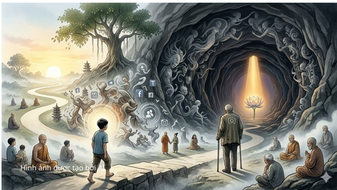
Hình ảnh được tạo bởi AI

Thanh niên, khập khểnh trước vô vàn hấp lực ngõ rẽ vào đời. Thời gian dẫn lối, đôi chân bé vững vàng từng bước, thanh niên tự tin trên từng dấu chân, trung niên nhờ nhợn dè chừng ngón chân bấu vào sức sống .