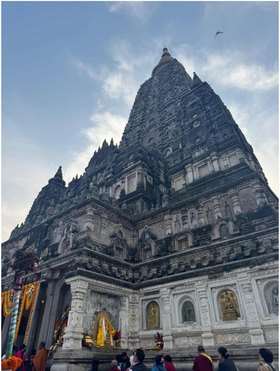
Đền Maha Bodhi, Bồ Đề Đạo Tràng.