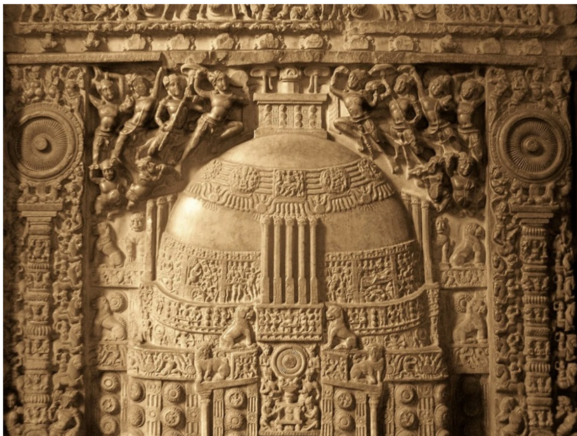
Phù điêu tháp Amaravati.

Chuyển Pháp luân lần thứ nhất tại Vườn Lộc Uyển đặt nền tảng với Tứ diệu đế , giới luật và con đường giải thoát dành cho Thanh văn (śrāvaka) và Duyên giác (pratyekabuddha). Lần thứ hai tại Linh Thứu Sơn khai mở hệ thống kinh Bát Nhã, giáo lý tính Không (sūnyatā), cắt đứt chấp thủ vào tự tính cố hữu. Và lần thứ ba tại Dhanyakataka chính là đỉnh điểm: Đức Phật xuất hiện dưới hình tướng Kalachakra để truyền trao sự hợp nhất bất nhị giữa tính Không và Phật tính, kết nối thời gian vũ trụ, chu kỳ thiên văn và hệ thống kinh mạch vi tế trong thân người thành con đường giác ngộ trực tiếp.