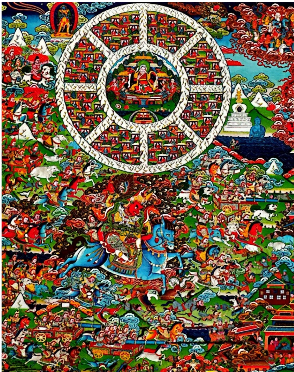
Hình ảnh Shambhala theo truyền thống Bhutan.

Hơn nữa, truyền thừa sống còn có chức năng “hiệu chỉnh sai lệch”: khẩu truyền từ bậc thầy giúp làm rõ những đoạn khó hiểu, sửa lỗi thiên tập và điều chỉnh pháp tu phù hợp căn cơ. Nếu thiếu điều này, ngay cả văn bản chính xác nhất cũng có thể bị hiểu sai.