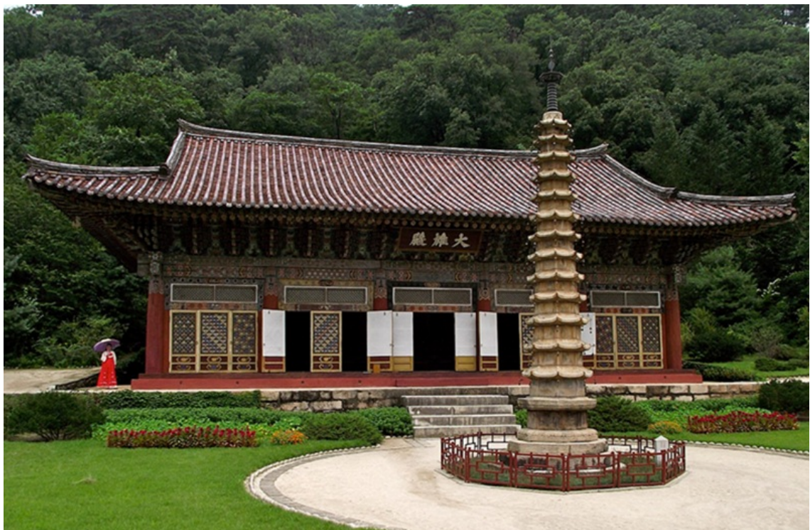
Điện Daeungjeon, một bảo vật quốc gia của Cộng hòa Dân chủ Nhân dân Triều Tiên

Cảm giác đầu tiên khi bước vào khuôn viên Chùa Phổ Hiền là sự choáng ngợp bởi vẻ đẹp và sự tĩnh lặng của thiên nhiên . Dãy núi Myohyang, được xem là một trong những ngọn núi linh thiêng nhất Triều Tiên, bao bọc ngôi chùa trong một bầu không khí hoàn toàn trong lành và lặng sạch, thanh tịnh như hư không.