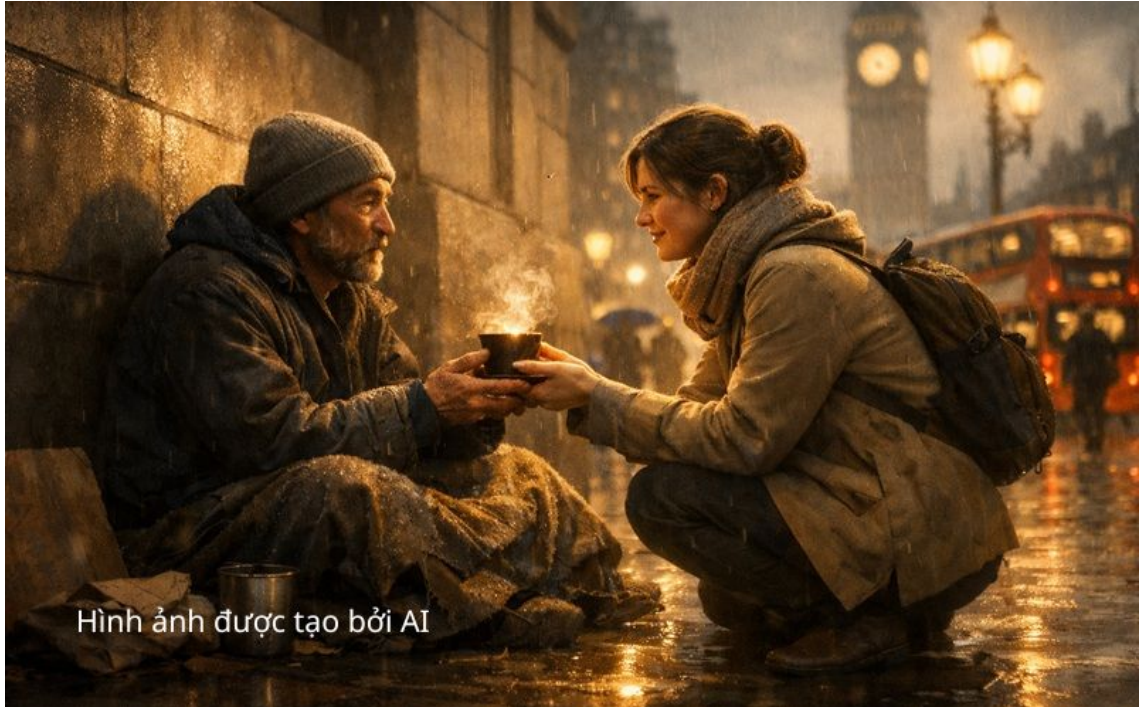
Hình ảnh được tạo bởi AI

Hãy hình dung bạn gặp David, một người vô gia cư trên đường đi làm. Vì những tổn thương tâm lý nghiêm trọng, anh mất việc, mất nhà cửa và phải sống lang thang trên đường phố London.