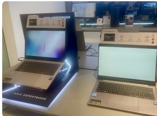
Asus Exclusive Store đầu tiên tại Việt Nam (161 Xã Đàn, Hà Nội)