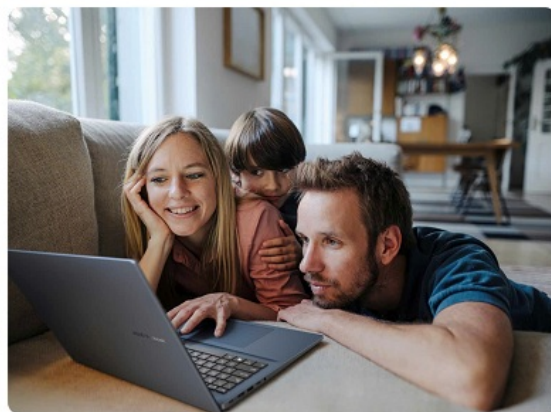
Một số dòng "laptop AI" mới nhất của Asus.