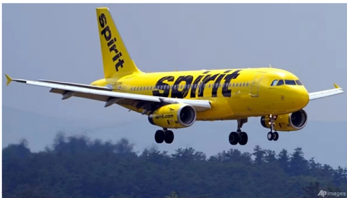
Các chuyến bay bị hủy hàng loạt sau khi Spirit Airlines tuyên bố ngừng hoạt động, phản ánh tác động lan rộng của cú sốc giá nhiên liệu đối với ngành hàng không toàn cầu.

Giá dầu tăng, thị trường tài chính biến động, chuỗi cung ứng chịu áp lực và ngành hàng không trở thành một trong những lĩnh vực phản ứng nhạy cảm nhất.