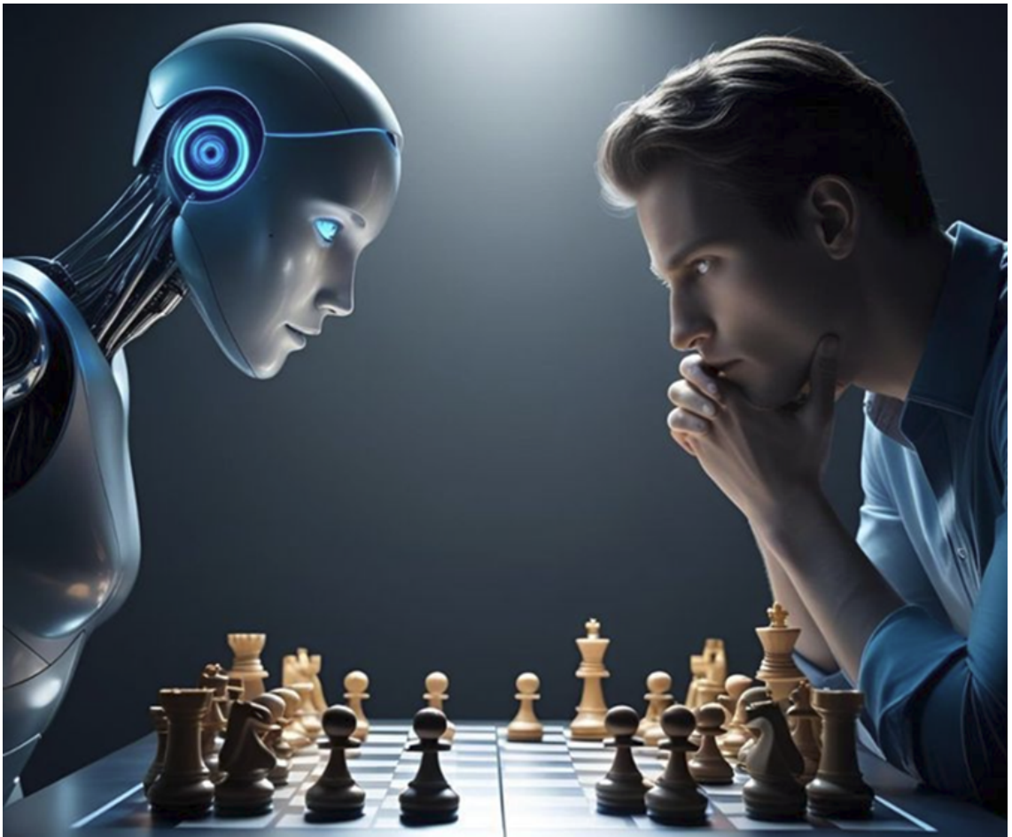
Hình ảnh chỉ mang tính chất minh họa.