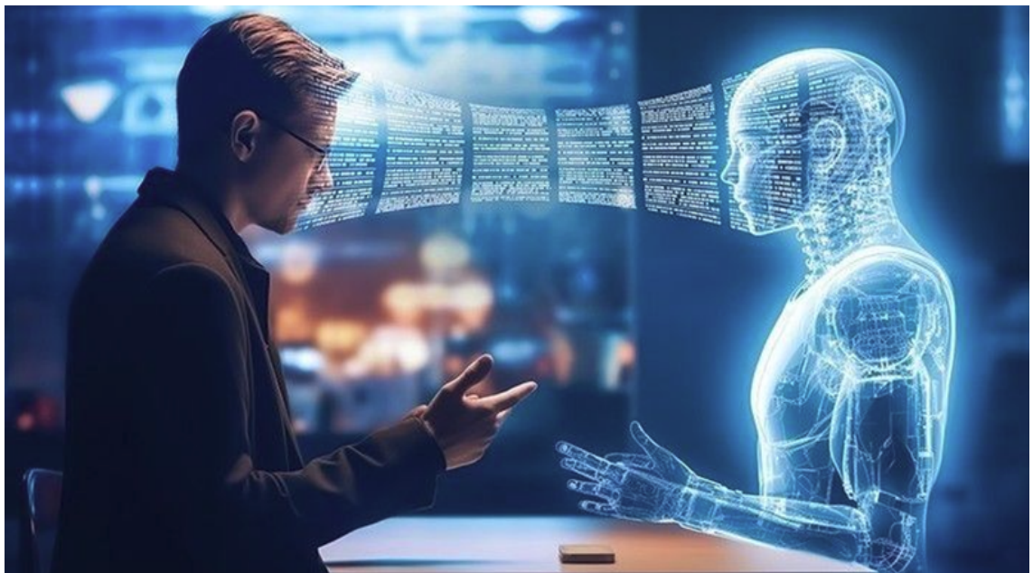
Hình ảnh chỉ mang tính chất minh họa. Ảnh sưu tầm