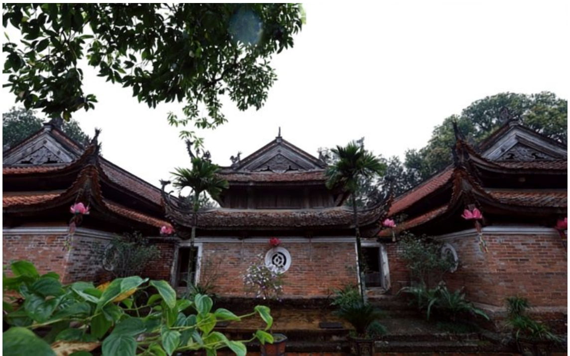
Hình minh họa chùa thời nhà Lê.

Trước tiên, hãy nói về “quân trưởng”. Từ này nên giải thích ra sao? Cần nhắc lại rằng nhà Lê có cách dùng từ không chuẩn mực nên “quân trưởng” có thể đa hàm các ý nghĩa từ trưởng làng, trưởng bản, thủ lĩnh một khu, cho đến vua một cõi. Tuy nhiên, theo cách sử dụng trong văn bản, thì danh nghĩa này được xác lập theo sau sự kiện “kiến bang khởi thổ”, khi mà Lê Hối đã có “sản nghiệp” sau 3 năm, với “con cháu ngày một đông, tôi tớ ngày một nhiều”. “Việc dựng nước mở đất, thực từ ấy mà nên” đẩy ý nghĩa của chữ “quân trưởng” vào một tầm vóc chính trị lớn hơn phạm vi của một thôn trang. Thậm chí, cách nói “từ đây, đời đời làm quân trưởng một miền” còn gợi cho ta thấy quan điểm chính thống và tham vọng quyền lực kết nối đến điều mà triều Hậu Lê về sau kì vọng. Có lẽ nào đại sự thiên hạ đã được tính toán từ ba đời trước thời Lê Lợi? Điều này khó có khả năng vì ta có thể ước tính thời đại của Lê Hối chưa xảy ra việc đô hộ của giặc Minh, nên nhu cầu cho việc phục quốc vẫn chưa xuất hiện. Cách ước tính này chúng ta sẽ làm rõ hơn ở phần sau. Tuy nhiên, vẫn tồn tại khả năng rằng chí lớn đã được nhà này gieo mầm từ rất sớm. Bên cạnh đó, một cách diễn giải đơn giản mà hợp lý hơn là lối diễn đạt mạnh mẽ trên được viết theo quan điểm suy tôn ngược về quá khứ, khi mà Lê Lợi đã lên làm vua, nắm giữ quốc thống.