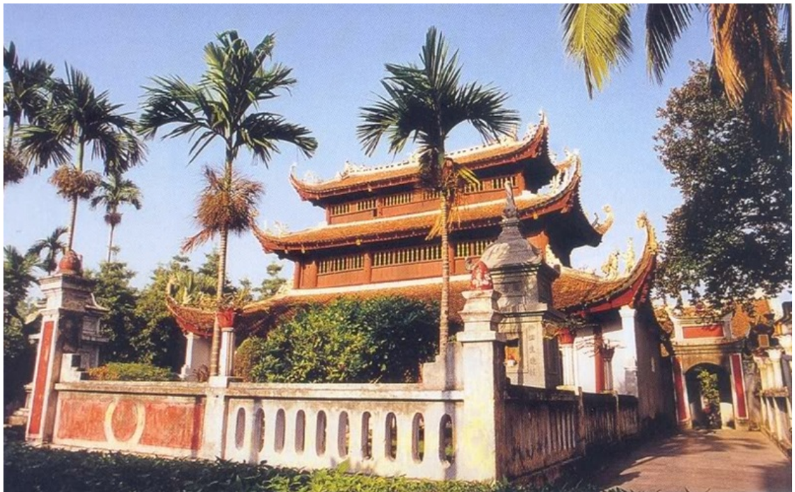
Hình minh họa chùa thời nhà Lê.

Trong bài này, Phan Huy Ích gọi Ngô Thì Nhậm, anh vợ mình, là “sư công”. Ta biết khi này, Ngô Thì Nhậm đã đi tu theo Phật giáo. Thật vậy, trong bài Cảm hứng họa Thị Ngự công chi tác , Ngô Thì Nhậm có họa lại bài thơ trên của Phan Huy Ích, với nguyên dẫn như sau: