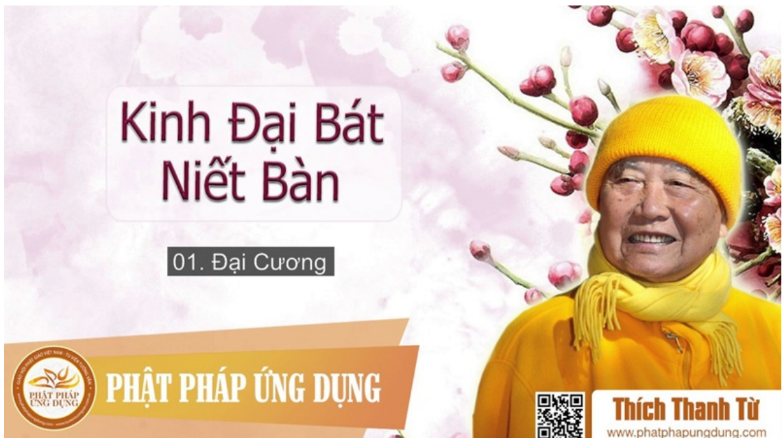
Hình mang tính minh họa.

Từ góc độ lịch sử tư tưởng, sự khác biệt giữa các bản dịch của hệ kinh Niết bàn cho thấy đây không phải một hệ tư tưởng cố định ngay từ đầu, mà là kết quả của quá trình phát triển và tái diễn giải qua nhiều tầng văn bản khác nhau.