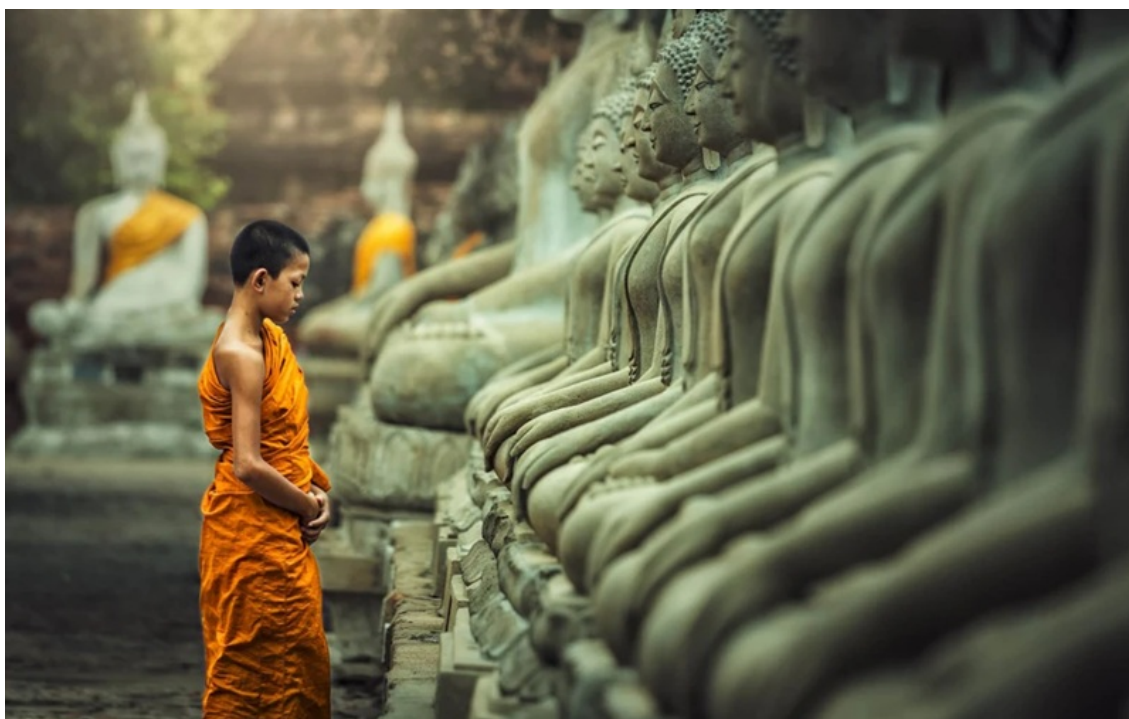
Hình mang tính minh họa.

Đoạn kinh dưới đây đặc biệt quan trọng vì nó cho thấy Đại Bát Niết bàn Kinh không tiếp cận Phật tính như một thực thể cố định có thể nắm bắt bằng khái niệm luận lý thông thường. Khi được hỏi vì sao nhất xiển đề có Phật tính mà vẫn đọa địa ngục, kinh văn lại trả lời: “trong nhất xiển đề không có Phật tính”, rồi ngay sau đó lập tức triển khai thí dụ cây đàn để giải thích rằng Phật tính “vốn không chỗ trụ”, phải nhờ phương tiện thiện xảo mới có thể hiển lộ. Điều này cho thấy kinh văn không chủ trương khẳng định tuyệt đối theo kiểu bản thể luận giản đơn rằng “nhất định có” hay “hoàn toàn không”, mà nhấn mạnh đến điều kiện chuyển hóa để Phật tính được nhận ra và hiển hiện.