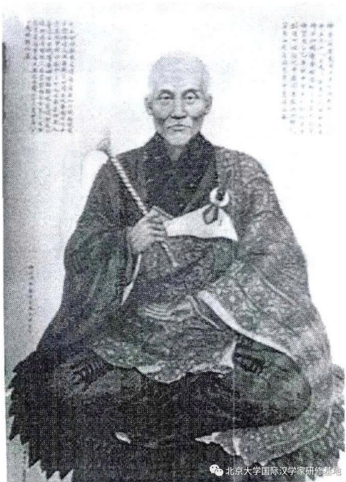
Di ảnh Tổ sư Nguyên Thiều

Thiền sư Nguyên Thiều (1648-1728), pháp tự Hoán Bích, họ Tạ, nguyên quán tại huyện Trình Hương, phủ Triều Châu, tỉnh Quảng Đông, Trung Hoa. Năm 1666 (mười chín tuổi), ngài xuất gia tại chùa Báo Tư. Đến năm 1677, ngài theo thuyền buôn sang phương Nam để truyền đạo, dừng chân tại phủ Quy Ninh (nay thuộc tỉnh Bình Định), nơi ngài khai sơn Tổ đình Thập Tháp Di Đà.