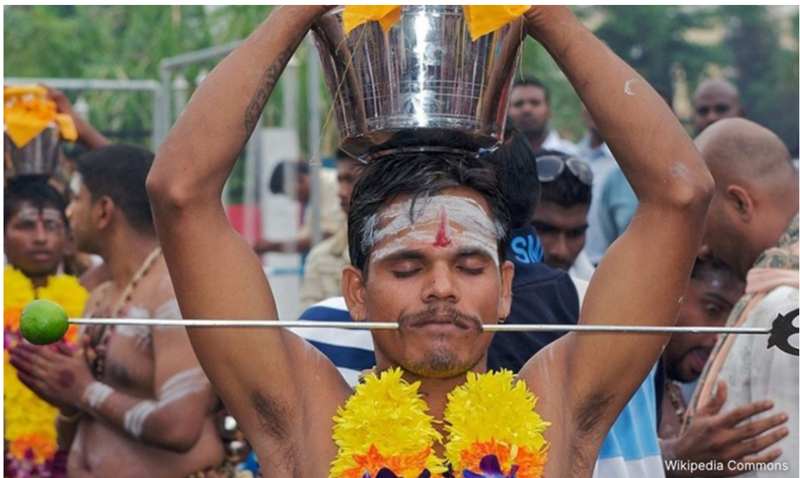
Một người đàn ông thực hành nghi lễ xô khuyên trong lễ Thaipusam năm 2025

Các tập tục như melenggang perut (nghỉ lễ dành cho phụ nữ mang thai), tục xát muối lên môi trẻ sơ sinh, xô lỗi tai hay hỏa táng từng được xem là có nguồn gốc từ truyền thống Hindu giáo.