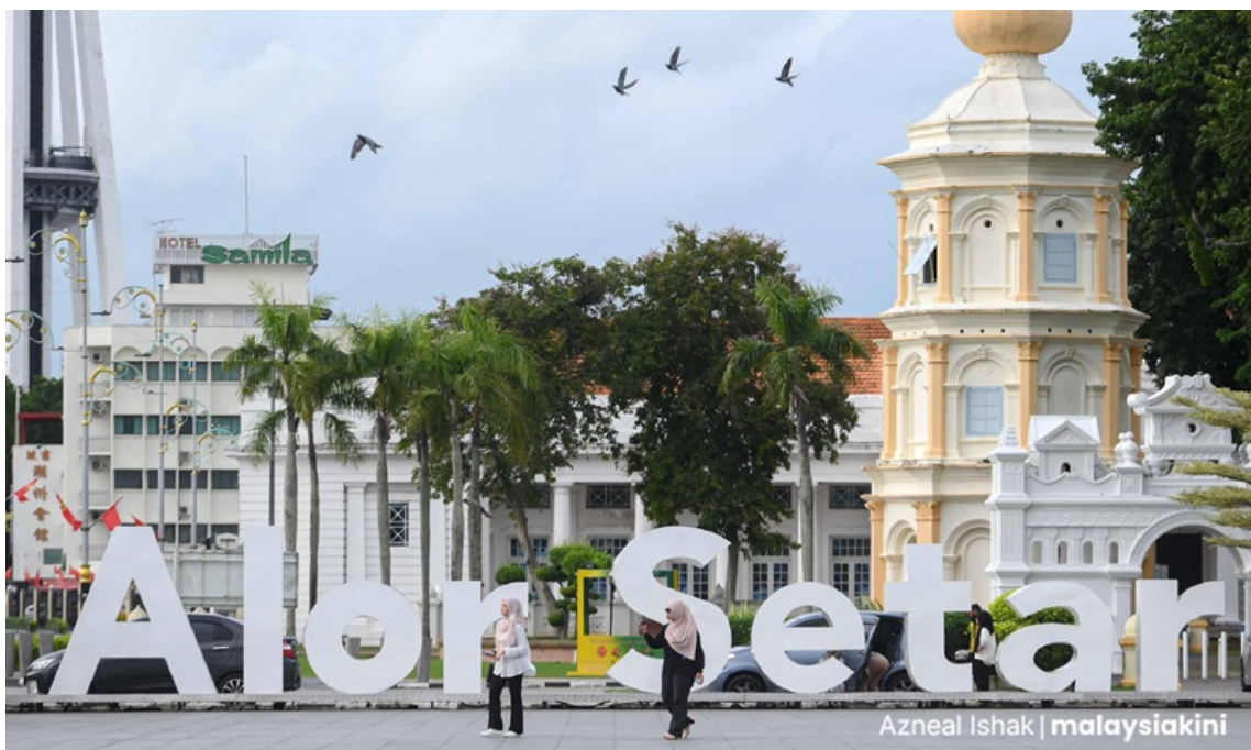
Alor Setar, Kedah

Báo cáo thường niên năm 1957 của Liên bang Malaya cũng đề cập những bằng chứng cho thấy các cộng đồng người Nam Ấn từng cư trú đáng kể quanh khu vực núi Kedah từ thế kỷ IV đến thế kỷ XII.