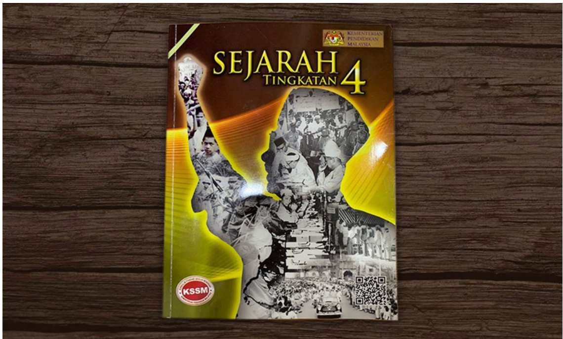
Sách giáo khoa lịch sử, khoảng năm 2022.

Học sinh cần được biết rằng Ấn Độ giáo và Phật giáo từng phát triển rực rỡ trên nhiều vùng của bán đảo Mã Lai, để lại những dấu ấn sâu đậm trong đời sống văn hóa, tổ chức nhà nước, ngôn ngữ và thế giới quan của cư dân bản địa.