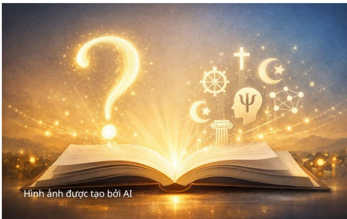
Hình ảnh được tạo bởi AI

Tính chặt chẽ trong phương pháp của Kent trở nên đặc biệt quan trọng khi xem xét những trường hợp đương đại lẽ ra phải khơi dậy sự hoài nghi ngay lập tức.