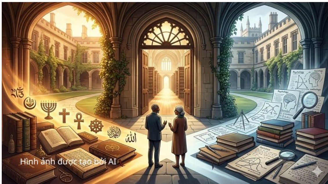
Hình ảnh được tạo bởi AI