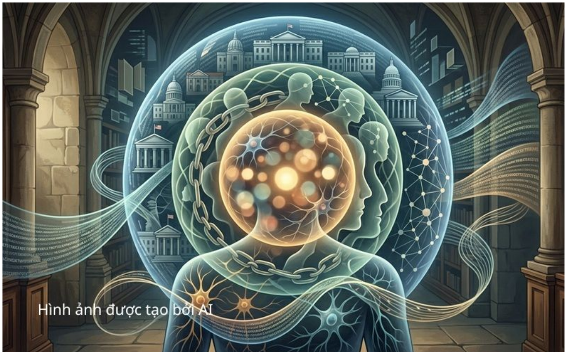
Hình ảnh được tạo bởi AI

Psychobiography không nhằm gán ghép các chẩn đoán tâm thần hiện đại cho những nhân vật lịch sử.