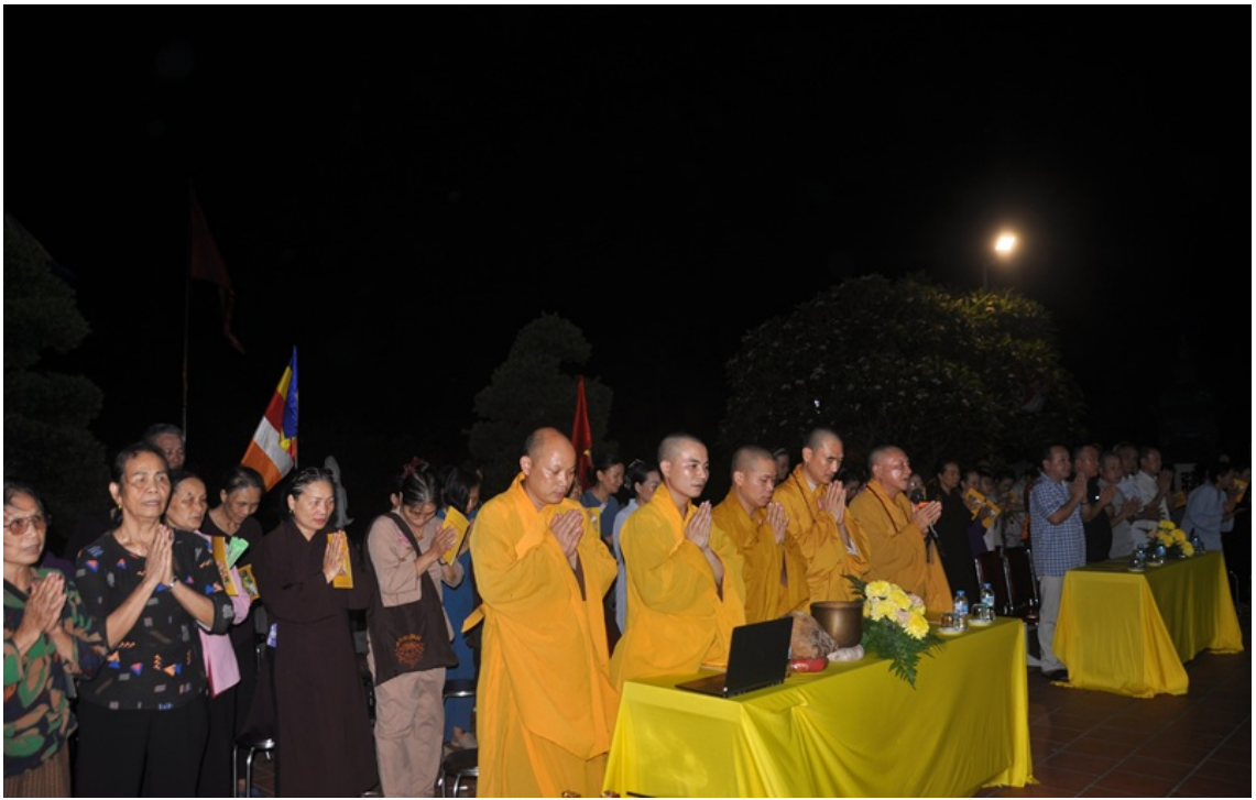
Niệm Phật cầu gia bị

Đại lễ năm nay diễn ra trong bối cảnh đặc biệt khi toàn thể tăng ni, Phật tử cả nước hân hoan đón mừng Phật đản PL.2570 - DL.2026, đồng thời hướng tới dấu mốc 45 năm thành lập Giáo hội Phật giáo Việt Nam . Hòa cùng niềm vui chung toàn dân tộc qua các sự kiện trọng đại như Quốc lễ Giỗ Tổ Hùng Vương và kỷ niệm 136 năm Ngày sinh Chủ tịch Hồ Chí Minh, Đại lễ Phật đản tại chùa Linh Thông càng thêm ý nghĩa, thể hiện tinh thần đồng hành cùng dân tộc của Phật giáo Việt Nam .