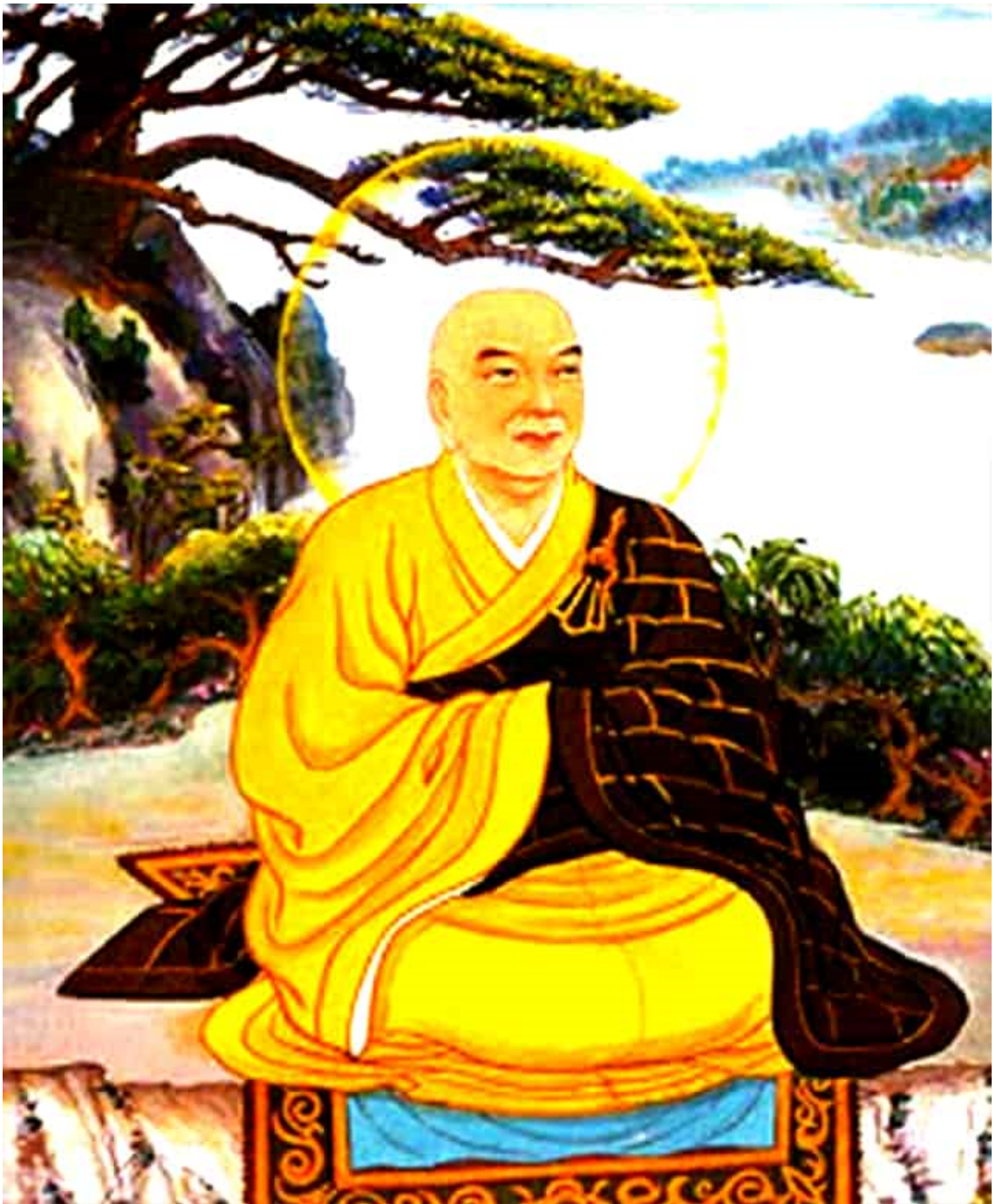
Đại thiền sư Huyền Quang

Trong đó, Các vị đại sư truyền thống Yên Tử như thiền sư Thường Chiếu, thiền sư Hiện Quang, Quốc sư Trúc Lâm, Trần Thái Tông, Tuệ Trung Thượng sĩ, Trần Thánh Tông... là những người đặt nền móng tư tưởng cho sự ra đời của Thiền phái. Kế thừa và phát huy tiền đề đó, Sơ tổ Trần Nhân Tông là người đưa Phật giáo ra đời và hiện thực trong đời sống, kế thừa y bát là Nhị tổ Pháp Loa và Tam tổ Huyền Quang .