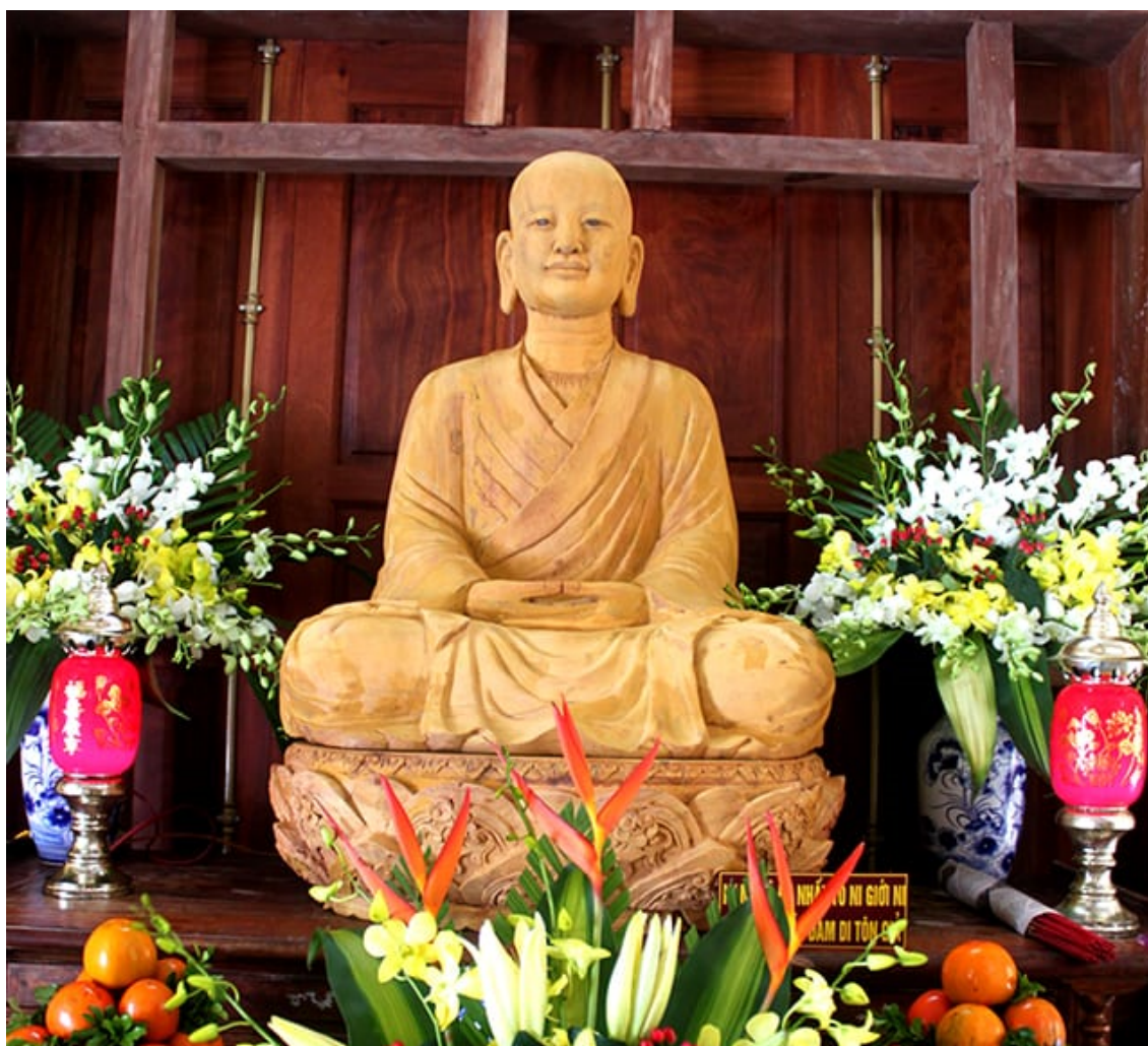
Thiền sư Pháp Loa là môn đệ của Phật hoàng

Căn cứ vào Tam Tổ thực lục , Tam Tổ hành trạng , Thiền tông bản hạnh , Thánh đăng lục ...thì quá trình hình thành và phát triển Phật giáo Trúc Lâm có một bề dày lịch sử đáng kể.