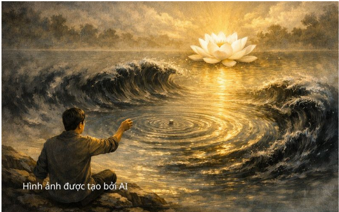
Hình ảnh được tạo bởi AI

Cũng như việc liên tục làm điều sai trái với một người có thể dẫn chúng ta đến sự thù ghét, thì một thái độ bền bỉ của lòng trắc ẩn và tử tế cũng có thể dẫn chúng ta đến tình yêu thương, ngay cả khi ban đầu chúng ta chưa cảm nhận được điều đó.